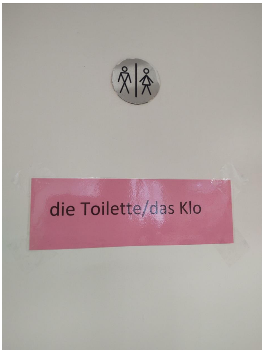
Na zdjęciu niemiecki napis na drzwiach toalety- das Klo