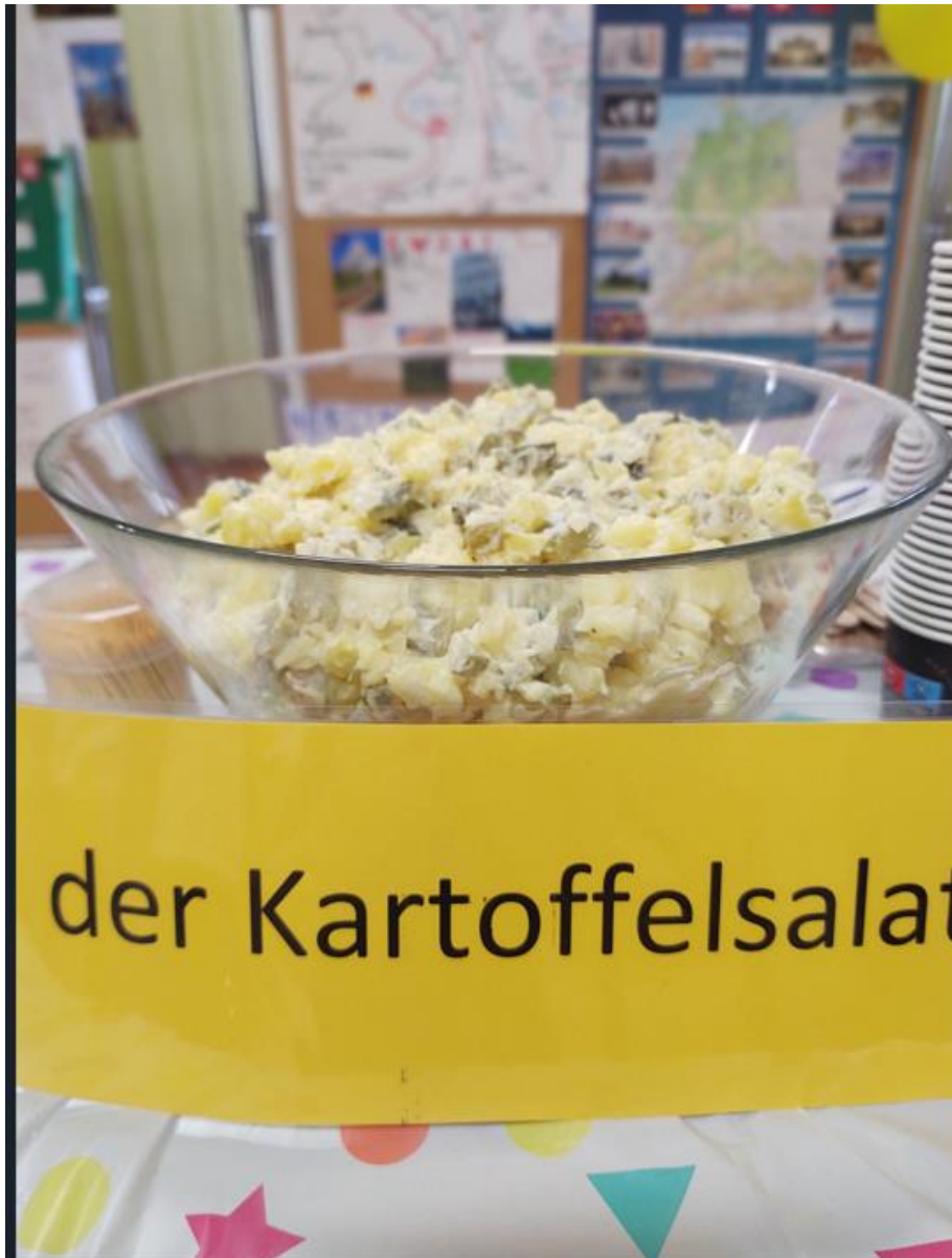
Pyszna sałatka ziemniaczana- der Kartoffelsalat