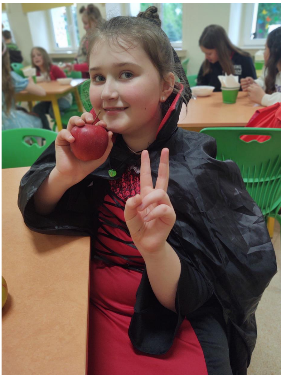
Na zdjęciu dziewczynka przebrana za złą Macochę, bohaterkę Baśni Braci Grimm.