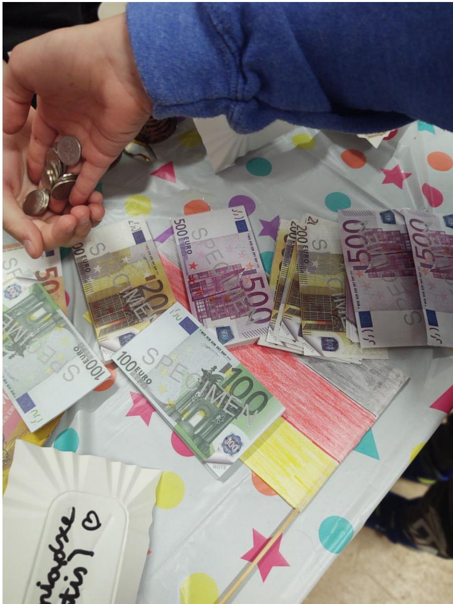
Euro- Waluta Unii Europejskiej