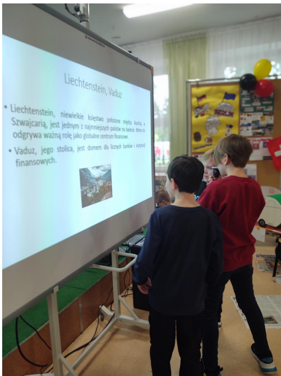
Uczniowie klasy IV B zapoznają się z prezentacją Księstwa Liechtenstein.