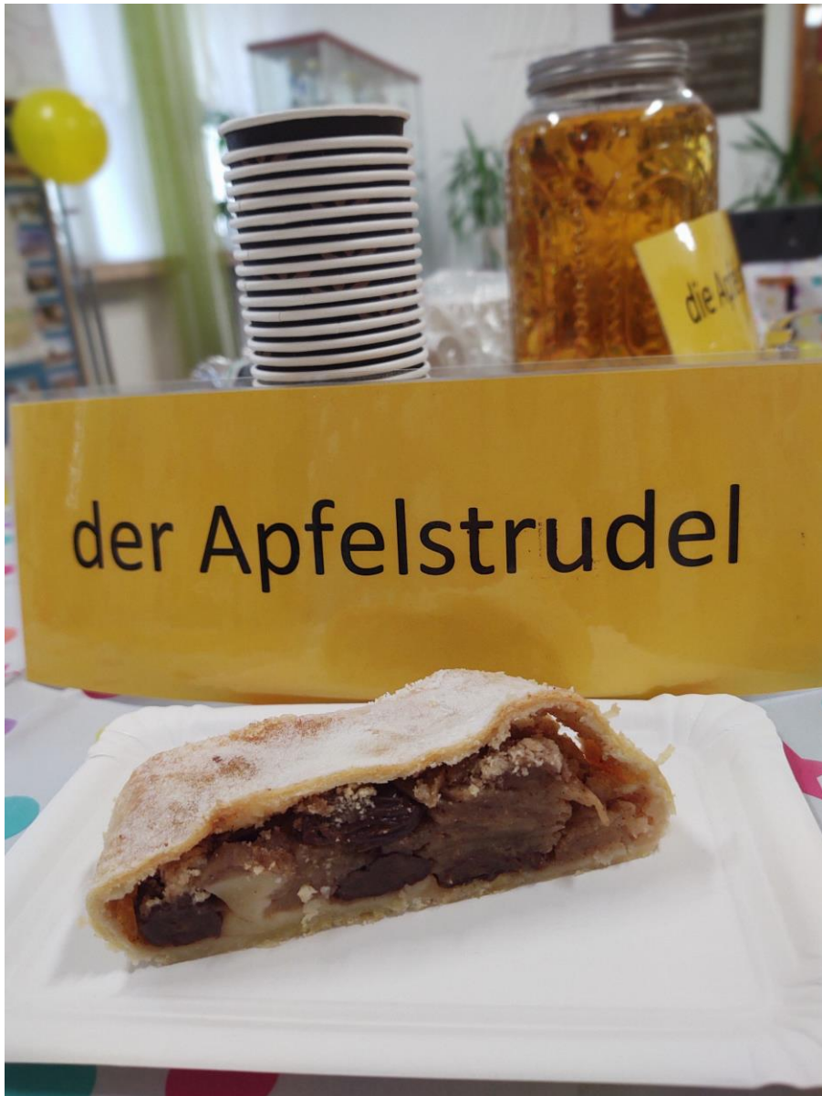
Strudel jabłkowy- der Apfelstrudel