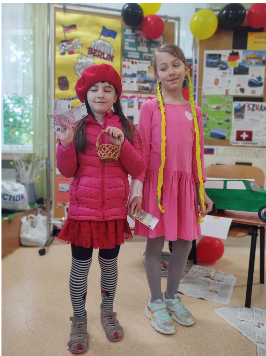
Na zdjęciu Czerwony Kapturek z Roszpunką- bohaterki Baśni Braci Grimm