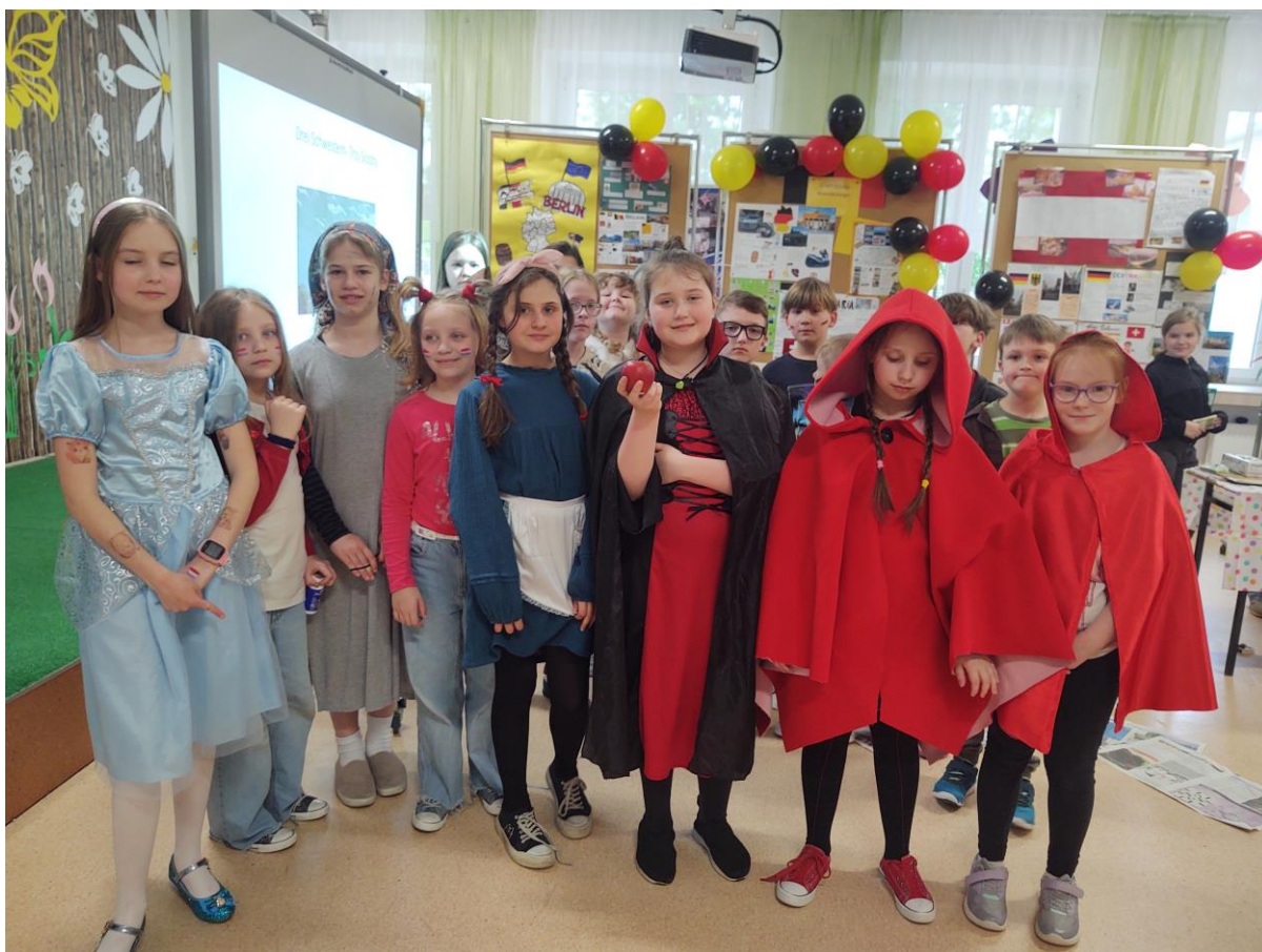
Na zdjęciu zwycięska klasa w konkursie- Bohaterowie Baśni Braci Grimm