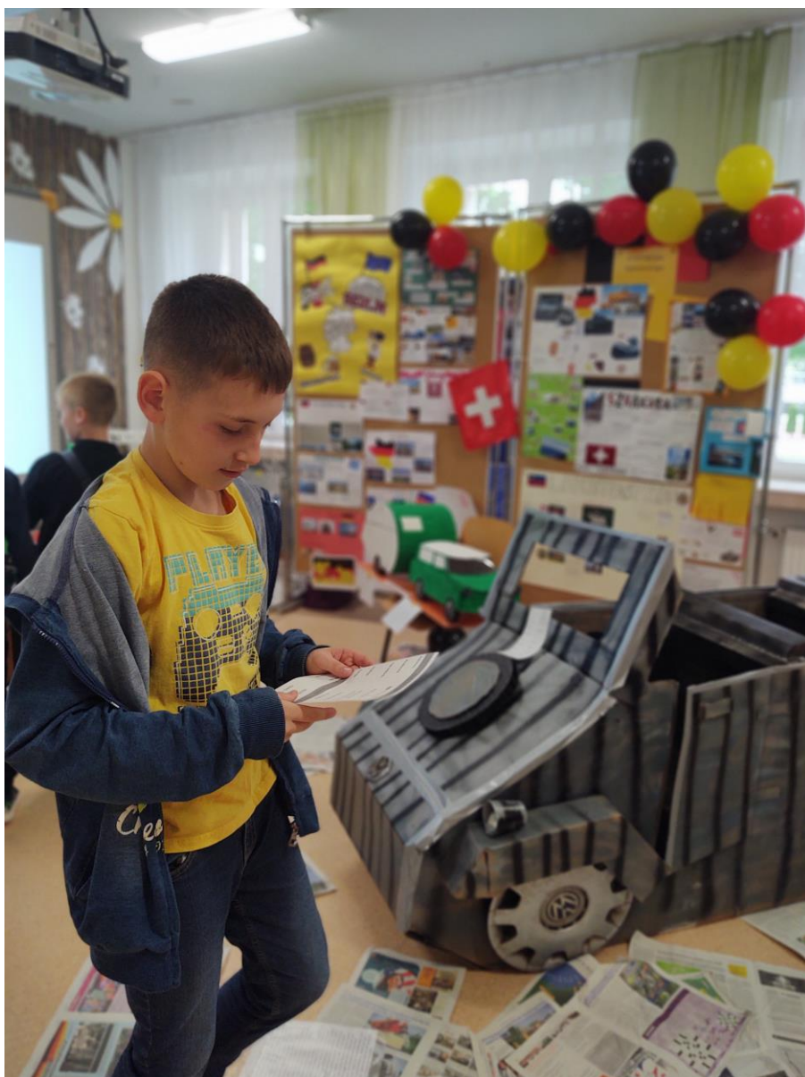
Uczeń zapoznaje się z informacjami związanymi z Volkswagenem Kuebelwagen.