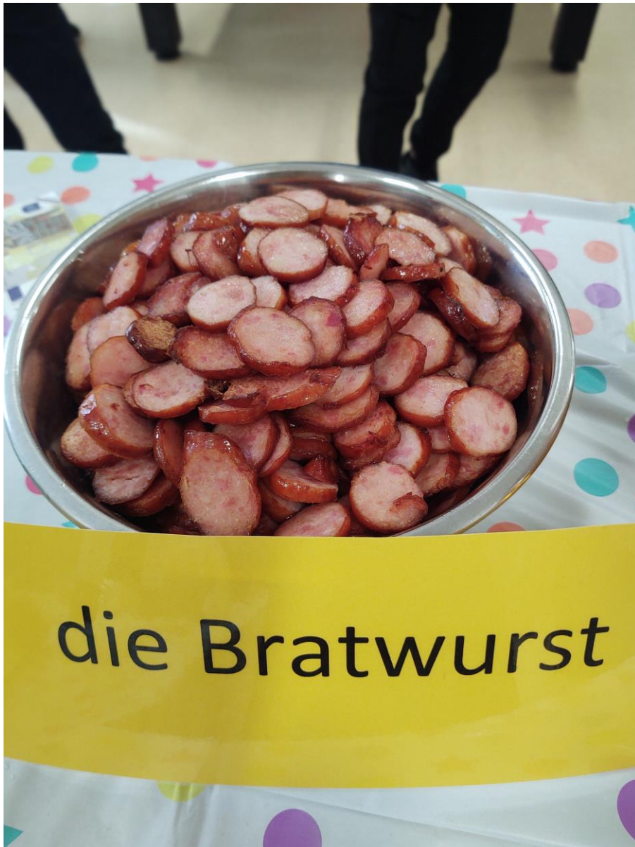
Smażona kiełbaska- die Bratwurst