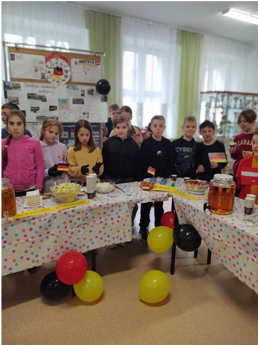
Klasa IVB zachęca do skosztowania specjałów kuchni niemieckiej. Na zdjęciu sałatka ziemniaczana, precele, kielbaska smażona i napój jabłkowy (Apfelschorle).