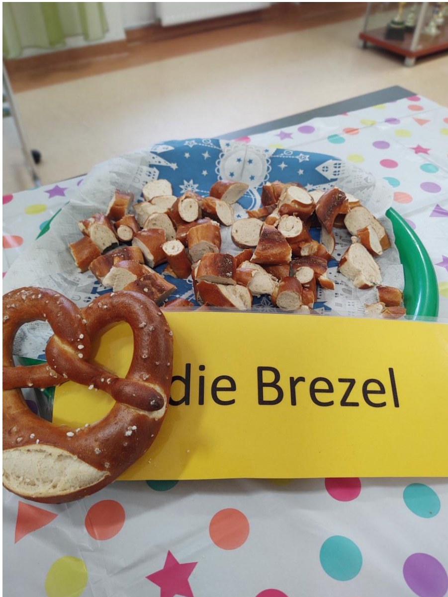
Precel- die Brezel