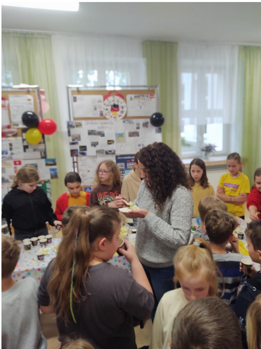
Degustacja smakołyków obszaru niemieckojęzykowego