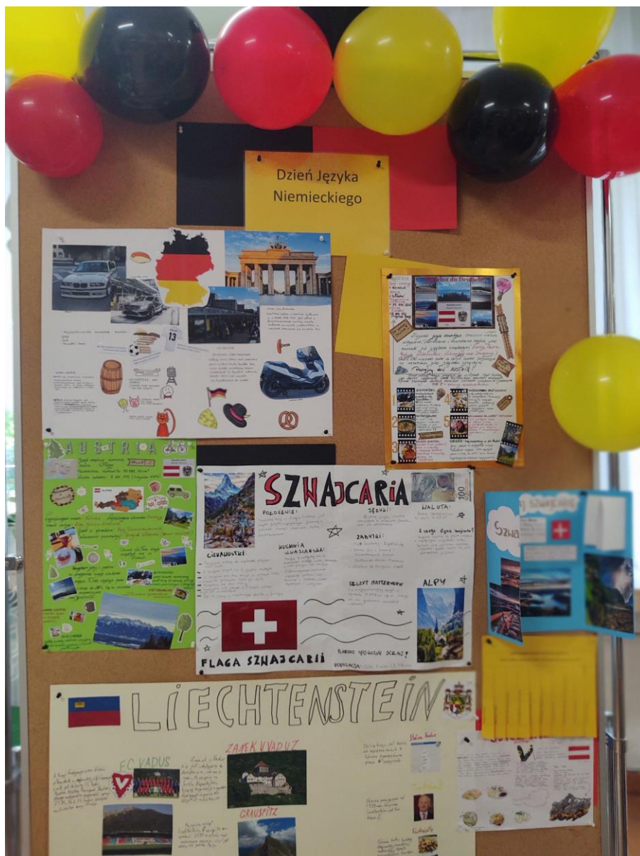
Plakaty przedstawiające ciekawostki o krajach niemieckojęzycznych.